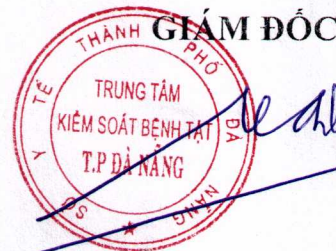
Tôn Thất Thạnh